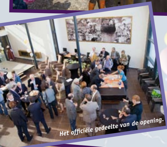
Het officiële gedeelte van de opening.