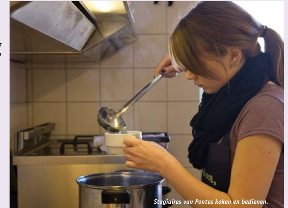
Stagiaires van Pontes koken en bedienen.