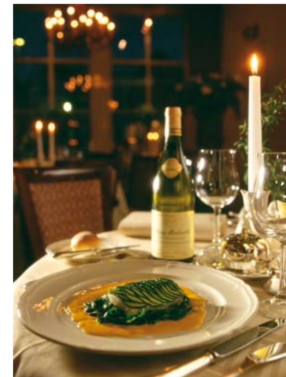
Zeeland telt vier sterrenrestaurants.

Ook vakantieparken, campings en horeca van hoge kwaliteit zijn in de hele provincie te vinden. Culinaire liefhebbers kunnen terecht in een keur aan restaurants, waaronder vijf stuks met één of meer Michelinsterren. Restaurant Oud Sluis in Sluis heeft drie sterren en staat daarmee, samen met De Librije in Zwolle, aan de top van Nederland. De Kromme Watergang, eveneens in Zeeuws-Vlaanderen, kan pronken met één ster, evenals La Trinité in Sluis. Datzelfde geldt voor Katseveer in Wilhelminadorp. Het restaurant is van oorsprong een veerhuis. Het veer tussen Katseveer en Zierikzee vaart echter al jaren niet meer. De komst van de Zeelandbrug maakte er in 1965 een eind aan. Het veerhuis ontwikkelde zich daarna langzaam maar zeker van café tot restaurant. ‘Cuisinier’ Rutger van