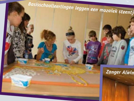
Basisschoolleerlingen leggen een mozaïek steentje.