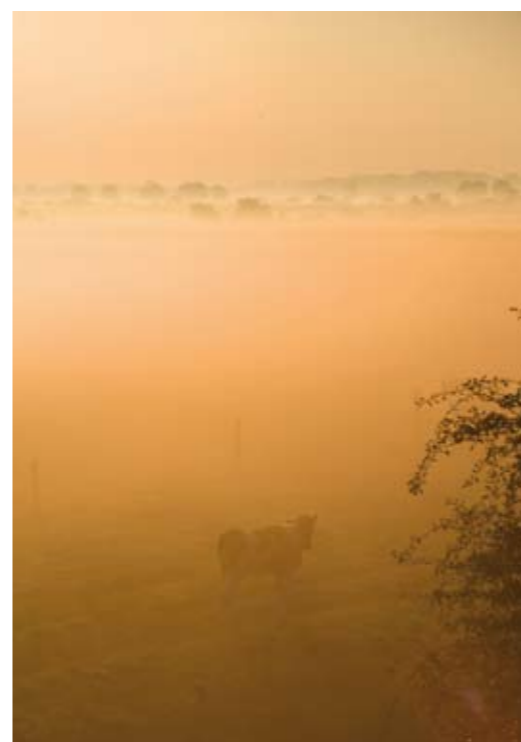
De Zak van Zuid-Beveland.

Inter Scaldes – gelegen op het smalste gedeelte van Zuid-Beveland, tussen Westerschelde en Oosterschelde – is een restaurant met twee sterren. Fijnproevers, ook van heinde en verre, waarderen de culinaire hoogstandjes van ‘patron-cuisinier’ Jannis Brevet. Deze echte Zeeuw gebruikt graag ingrediënten uit de directe omgeving, zoals kreeft, oesters, mosselen, zeebaars, zuiglam, zeekraal, lamsoren en kazen en fruit uit de Bevelandse polder.