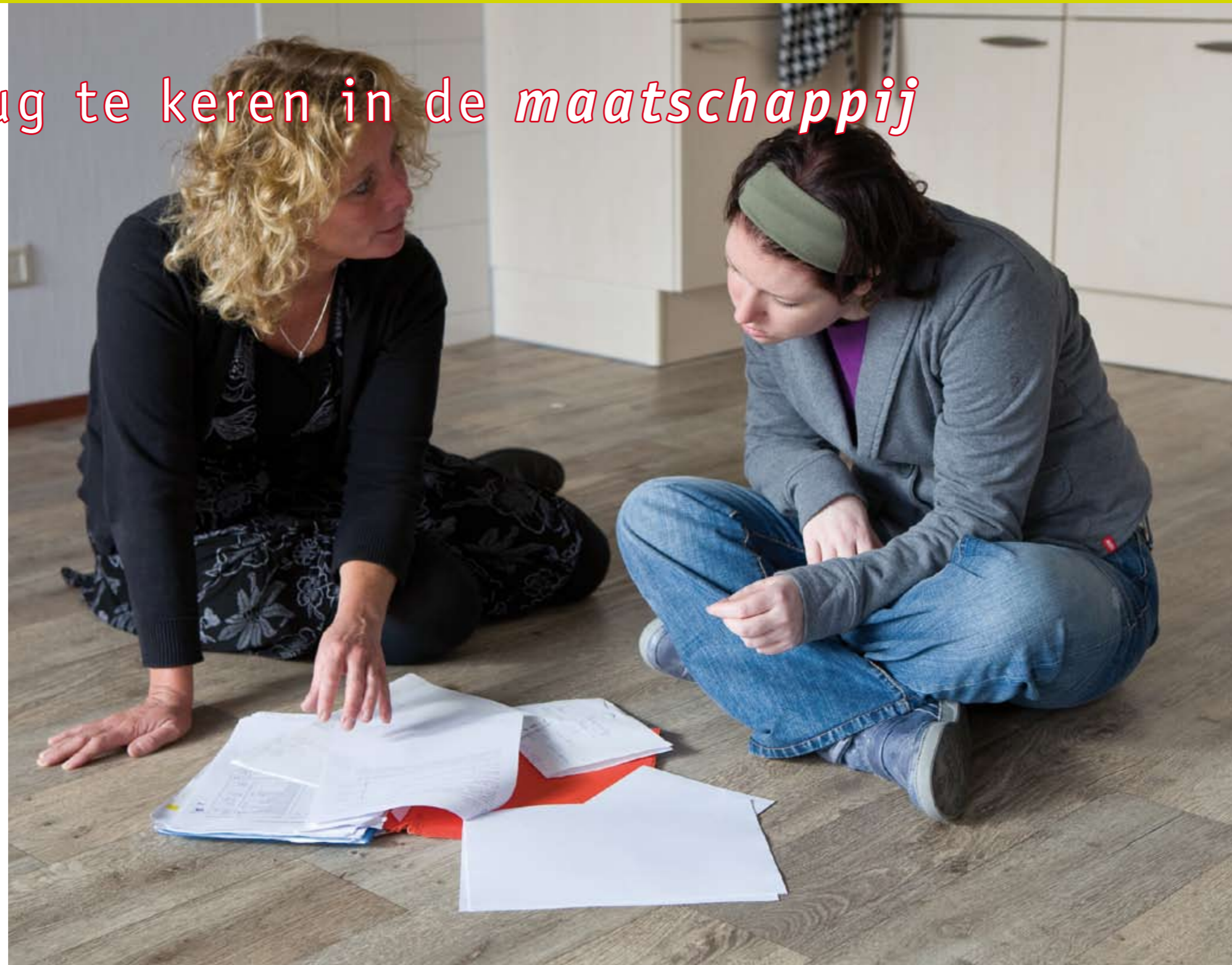
Woon(her)kansen biedt hulp bij het zelfstandig leren wonen.