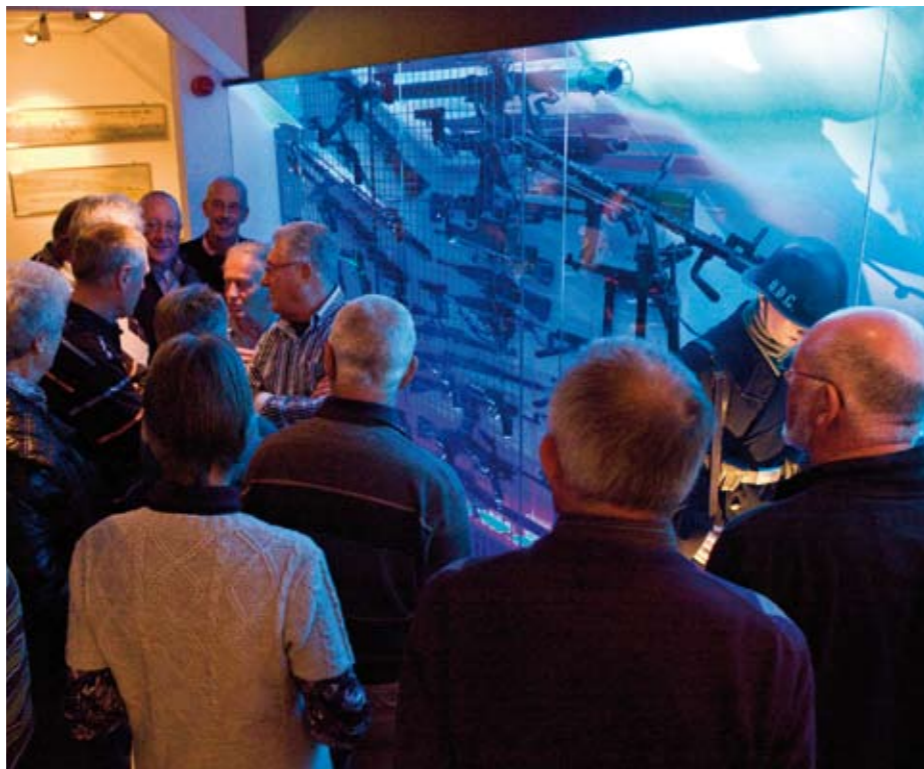
Het Bevrijdingsmuseum Zeeland trekt veel publiek.

Meer informatie over het museum, ook voor de openingstijden en de toegangsprijzen, is te vinden op www.bevrijdingsmuseumzeeland.nl .