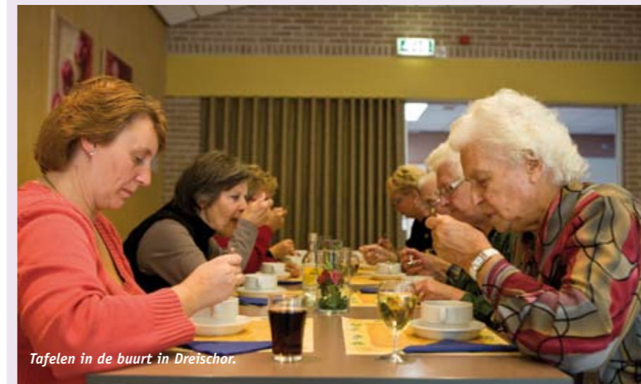
Tafelen in de buurt in Dreischor.