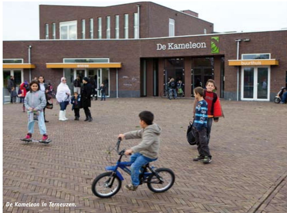
De Kameleon in Terneuzen.

Ook in Terneuzen komt het belang van een