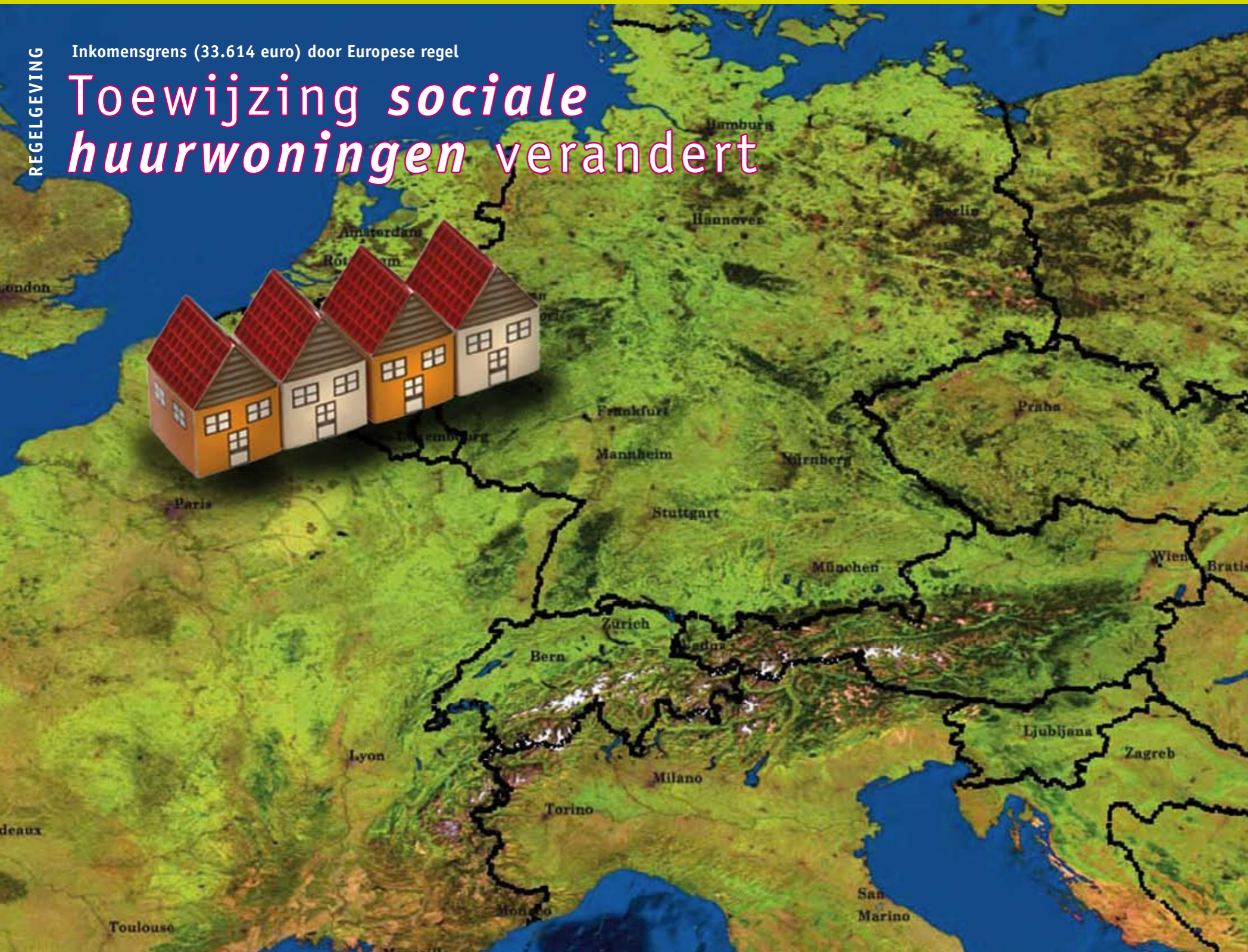
Europa beperkt staatssteun aan Nederlandse corporaties.

Vanaf 1 januari 2011 mogen corporaties hun sociale huurwoningen vrijwel alleen nog toewijzen aan huishoudens met een jaarkomen tot 33.614 euro. Woningzoekenden die meer verdienen hebben geen recht meer op zo'n woning (met een huur tot 652,52 euro per maand, prijspeil 2011). De Zeeuwse corporaties zijn niet blij met deze maatregel.